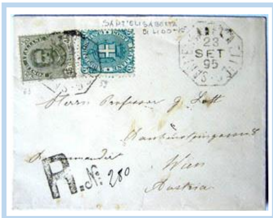
"SANT'ELISABETTA DI LIDO 23 SETT 1895" - Promossa al servizio raccomandate il 1.7.1883. Raccomandata per l'estero C. 50 (25c. lett. fino 15 gr. +25c. raccomand.)

Il Bullettino postale-telegrafico n. VIII del 30 dic. 1889 al § 434 annuncia che dal 1° luglio 1890 "per ragioni di economia saranno soppressi i cartellini numerati che si appiccicano sulle corrispondenze raccomandate ed assicurate e sostituiti da semplici bolli R.N. ... o ASSICURATO N° ... da completare con il numero scritto a mano".