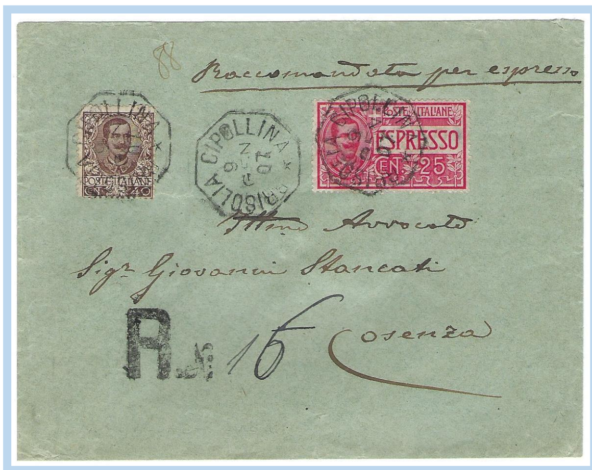
9.1.1907 - Lettera raccomandata espresso diretta a Cosenza affrancata 65 cent. (15c. tassa lett. fino 15gr. + 25c. tassa raccom. + 25c. tassa espresso) con due franc.li annullati con bollo ottag. " BRISOLIA CIPOLLINA 9 GEN. 07 ". A lato bollo " R N° 16 ". Per questa collettoria n.16 raccomandate fatte solo nei primi giorni dell'anno è giustificato probabilmente dal fatto che chi spedisce è il "CONSIGLIO PROVINCIALE DI CALABRIA CITERIORE".