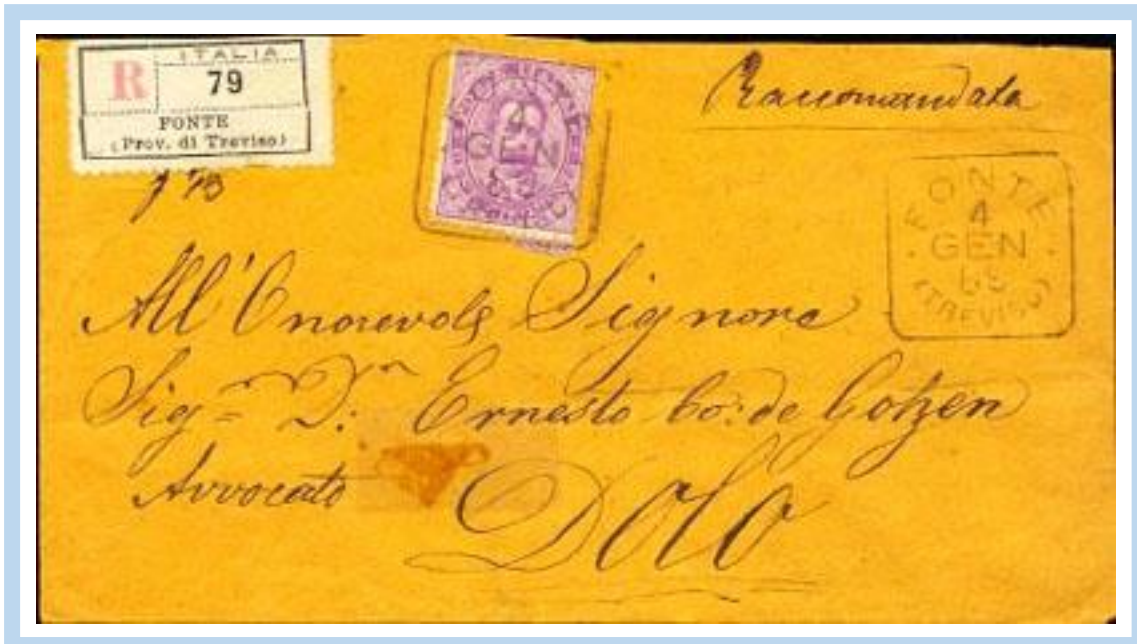
4.1.1889 – Lettera Raccomand. diretta a Dolo tassata 50c. (20c. porto lett. + 30c. raccomand.) con un franc. llo da 50c. annullato con bollo quadro "FONTE (TREVISO) 4 GEN. 89" . A lato etichetta con la "R" Rosso N. 79 . Ufficio autorizzato al servizio delle Raccomandate dal 1.4.1888.

Dal 1887 alcune collettorie di 2a classe vennero autorizzate al servizio delle raccomandate e per distinguerle da quelle di 1° classe con bollo ottagonale furono dotate di un bollo quadrato con data .