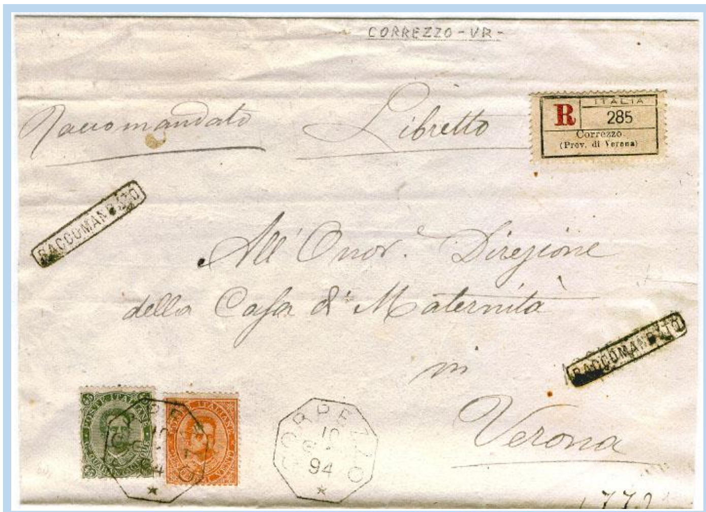
10.1.1894 – Lettera raccomandata con "libretto" diretta a Verona tassata 65c. (40c. lettera fino 20 gr. + 25c. raccomand.) e affrancata con due francobolli annullati con bollo ottagonale "CORREZZO 10 GEN 94". Sul fronte etichetta con "R" rosso e N.285 più due bolli (non necessari) RACCOMANDATO in riquadro applicati, probabilmente, per evidenziare l'importanza del "libretto".

A distanza di quasi 4 anni dall'entrata in uso del bollo "R. N..." alcune collettorie stanno adoperando ancora le scorte delle etichette. Che movimento e traffico postale !!! ... vedi i N. -