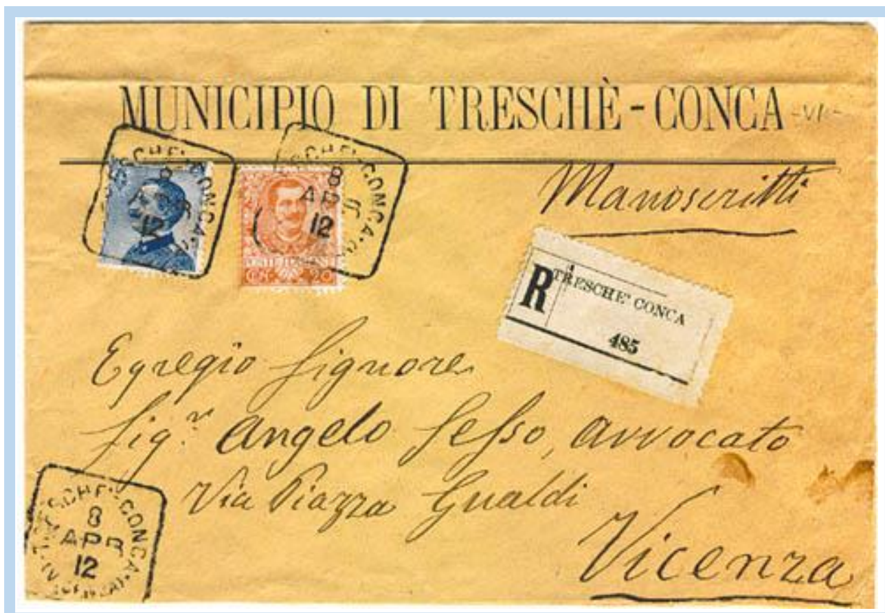
8.4.1912 – Lettera con manoscritti diretta a Vicenza tassata di 45c. (20c. manoscritti fino 50 gr. + 25c. racc.) con due francobolli annullati con bollo quadrato "TRESCHÈ CONCA (VICENZA) – 8 APR 1912" – Uso tardo del bollo di collettoria. Autorizzata al servizio delle raccomandate dal 1.6.1889.