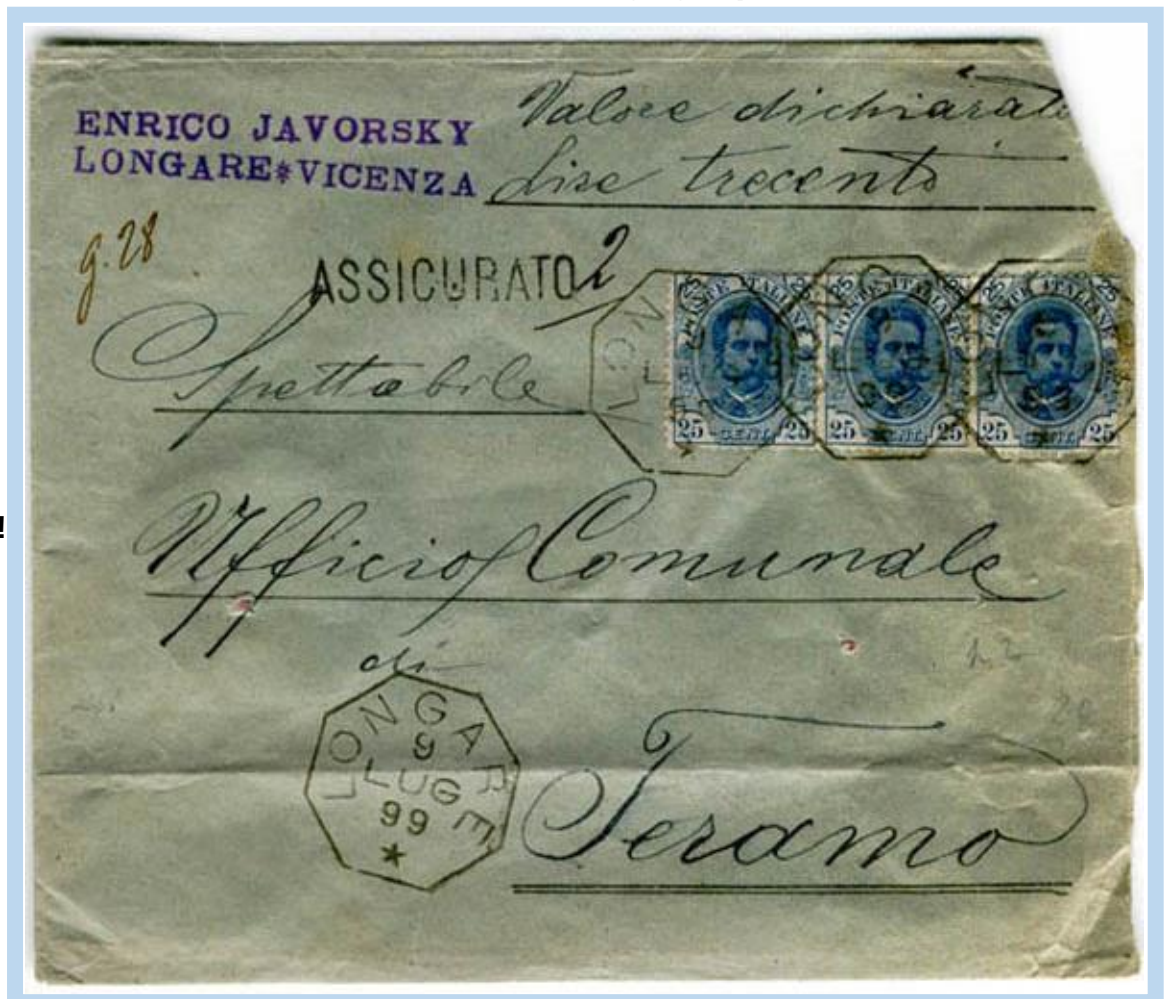
"LONGARE 9 LUG 99" – "ASSICURATO N. 2" Lire trecento. - N.2 in luglio !!! Tariffa 75 c. (40c. porto lett. fino 20 gr. + 25c. raccomand. + 10c. assicuraz.)