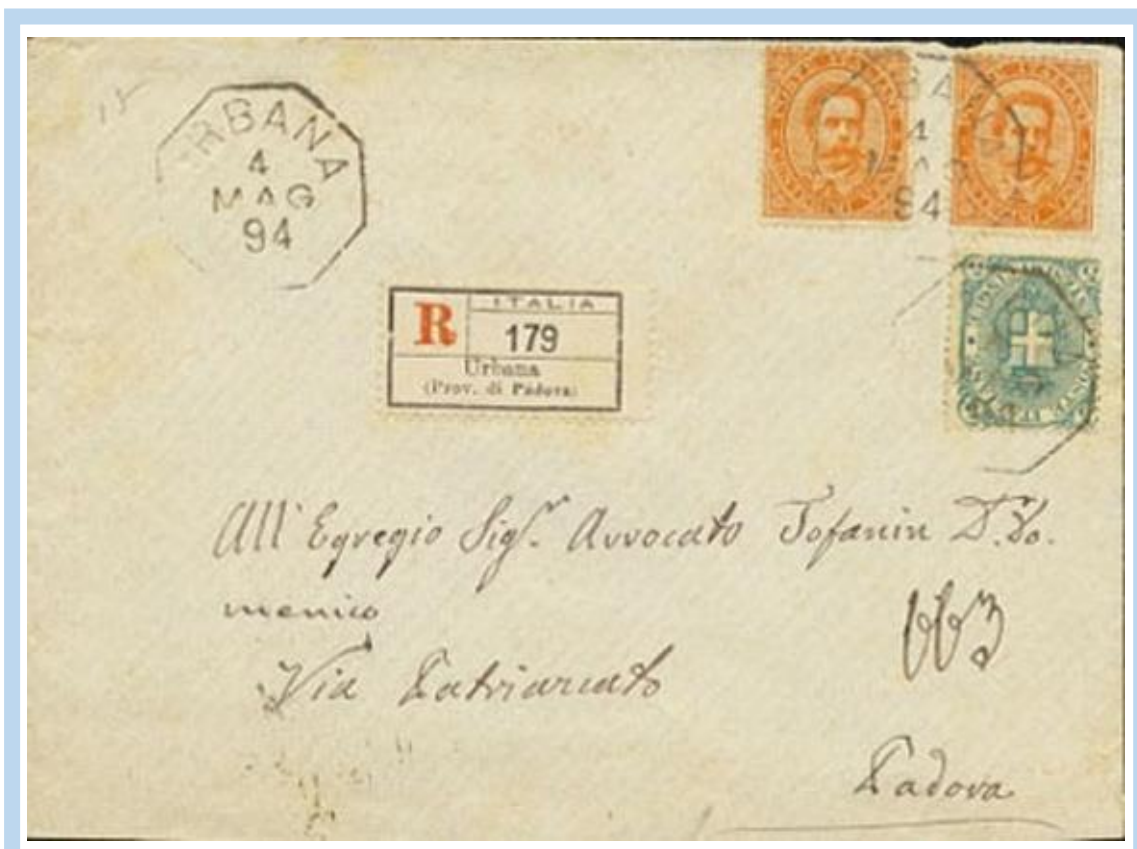
04.04.1894 - Lett. raccomandata diretta a Padova tassata di 45c. (20c. lett. fino 10 gr. + 25c. raccomand.) affrancata con due francobolli da 20c. + 1 da 5c. annullati con bollo ottag. di "URBANA 4 MAG. 94". A lato etichetta con la "R" rosso e N° 179.