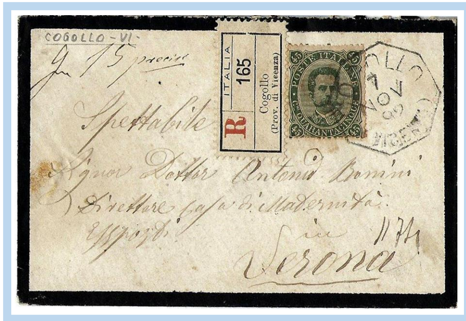
7.11.1892 - Lettera raccomandata diretta a Verona affr.ta con un 45c.(20c. lett. fino 15 gr. + 25c. raccomand.) annullata con bollo ottag. " COGOLLO (VICENZA) 7 NOV. 92 ". A lato etichetta con " R " rosso e N°165 .

Dal 1.7.1890 l'uso della etichetta sarebbe dovuto essere stato sostituito col bollo "R. N. ..", però, per ragioni di economia, fu concesso di utilizzarla fino ad esaurimento delle scorte dei bollettari.