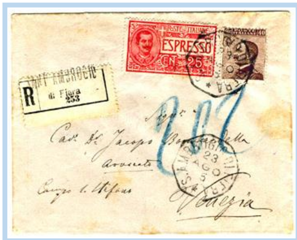
23.8.1915 -Lettera raccomandata espresso diretta a VE affrancata per 65c. (15c. porto lett. fino 15gr.+25c. raccomand.+25c. espresso) con un franc.llo da 40c. + un franc.llo da 25c. espresso annullati con bollo ottagonale " S. AMBROGIO DI FIERA 23 AGO. 15 ". Da notare che sul datario del bollo appare solo il 5 anziché l'anno completo 15 (o un errore di preparazione data o punzone difettato).