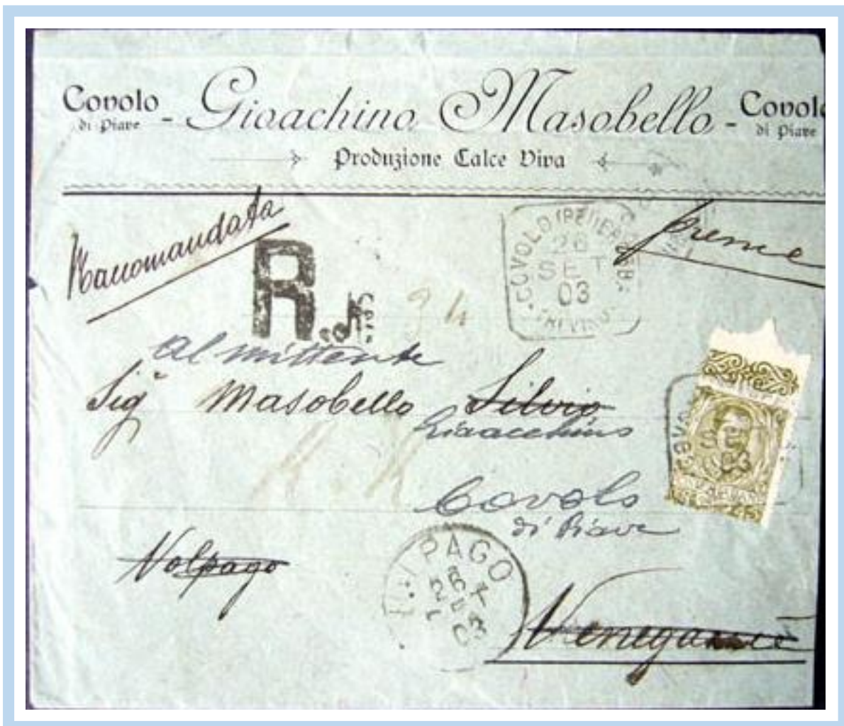
26.9.1903 - Lettera raccomandata diretta a Venegazze ma rispedita al mittente, tassata per 45c. (20c. porto lettera+ 25c. raccomand.) con un franc. llo annullato con bollo quadro "COVOLO (PEDEROBBA) 26 SET. 03" . A lato bollo "R N°34" . Ufficio abilitato al servizio raccomandate dal 1.10.1887.