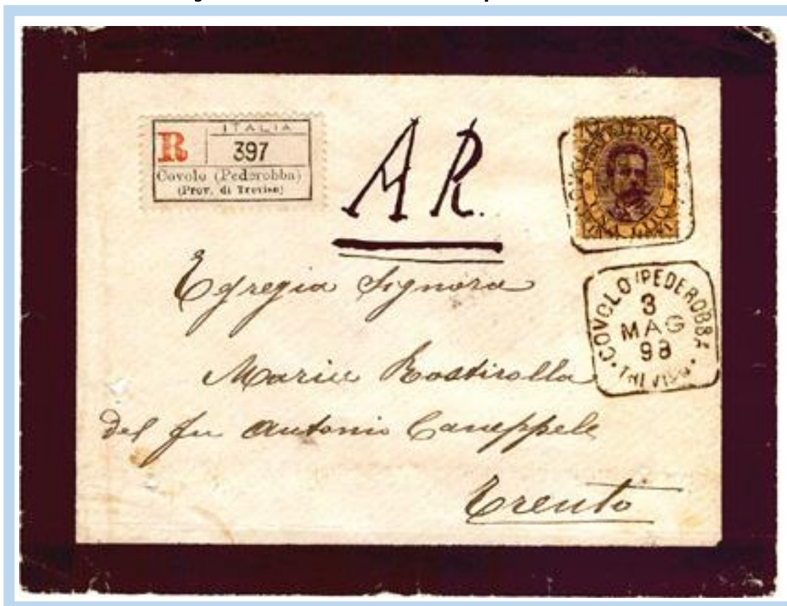
3.1.1898 – Lettera raccomandata con ricevuta di ritorno diretta a Trento (Austria) tassata di 1Lira (50c. porto lettera fino 30 gr.+ 25c. raccomand. + 25c. Ric. Rit.) con un francobollo annullato con bollo quadrato "COVOLO (PEDEROBBA) – TREVISO – 3 MAG. 1898" . Autorizzata al servizio raccomandate dal 1.10.1887.

Dal 1887 alcune collettorie di 2a classe vennero autorizzate al servizio delle raccomandate e per distinguerle da quelle di 1° classe con bollo ottagonale furono dotate di un bollo quadrato con data .