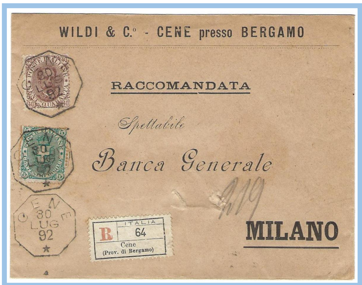
30.7.1892 - Lettera raccomandata per Milano affrancata per 45c. (20c. lettera fino 10 gr.+ 25c. raccomand.) con un 40c.+ 5c. annullati con bollo ottagonale "CENE 30 LUG. 92". A lato etichetta con la "R" rossa N.64 .