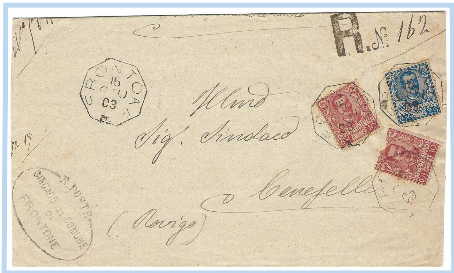
15.6.1903 - Raccomandata per Ceneselli affrancata per 45c. (20c. lett. fino 15 gr. + 25c. raccomand.) con tre francobolli annullati con bollo ottagonale "FRONTONE 15 GIU 03". A lato bollo di raccomandazione "R. N.162".