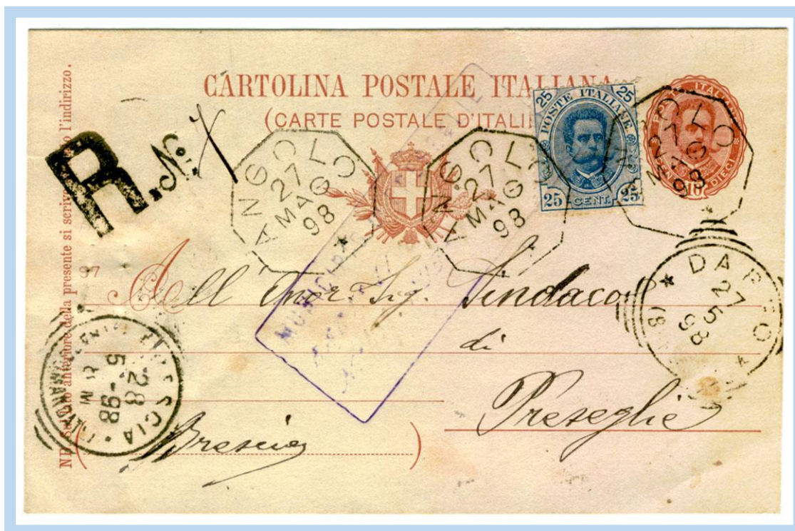
27.5.1898 - Cartolina postale di 10c. spedita Raccomandata da Angolo (BS) per Preseglie con aggiunta di 25c. (tassa di raccomandazione) annullata con bollo di collettoria ottag. " ANGOLO 27 MAG. 98 ". A lato bollo " R.N°7 " nero, in maggio!!!!