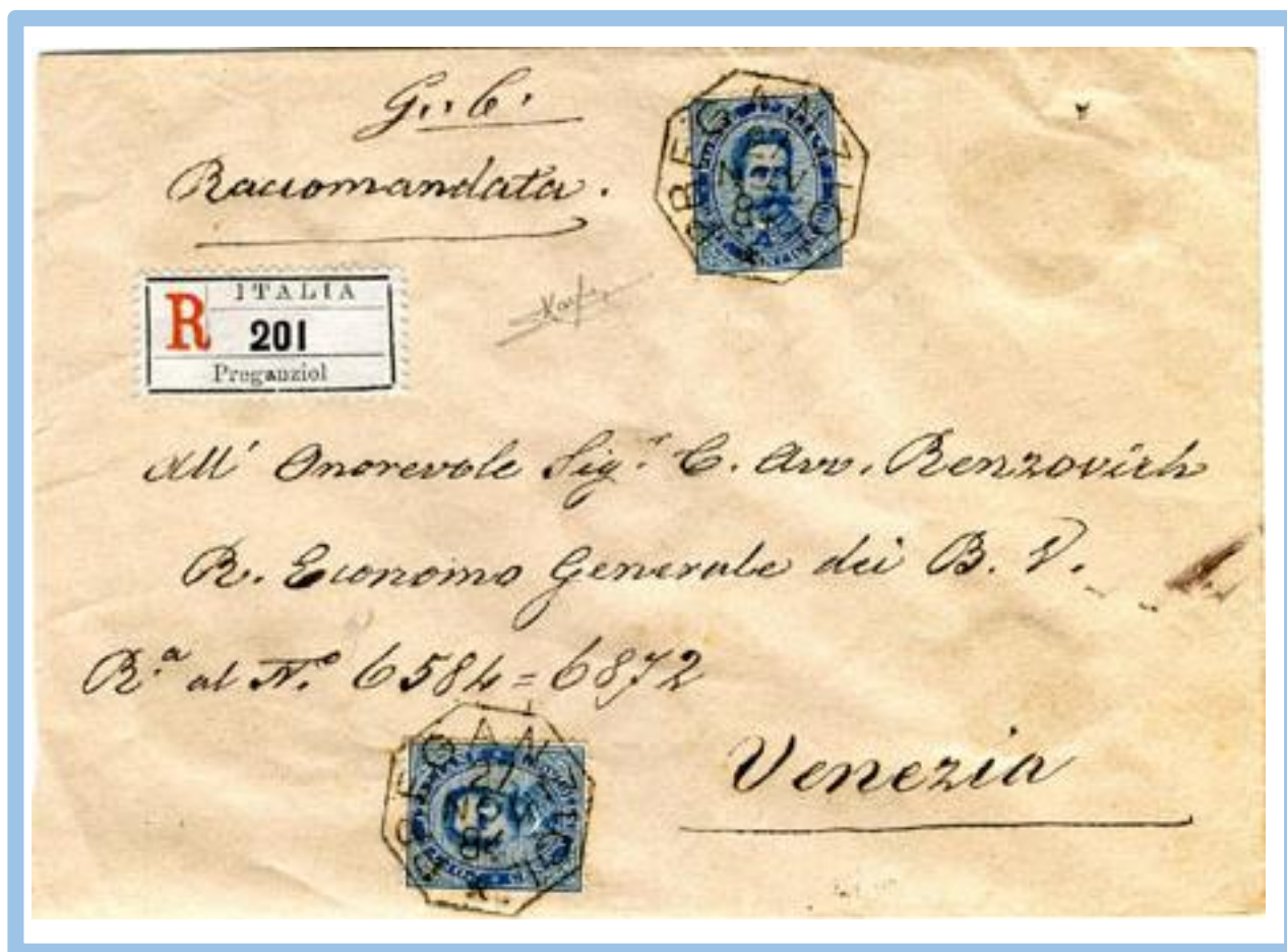
"PREGANZIOL 27 NOV 1884" - Raccomandata per interni tariffa cent. 50 (20c. porto lettera fino a 15 gr. +30c. raccomand.).

Cominciò il servizio rurale nel 3° trim. 1873 come collettoria di 2° classe, venne promossa al servizio delle raccomandate il 1.9.1883.