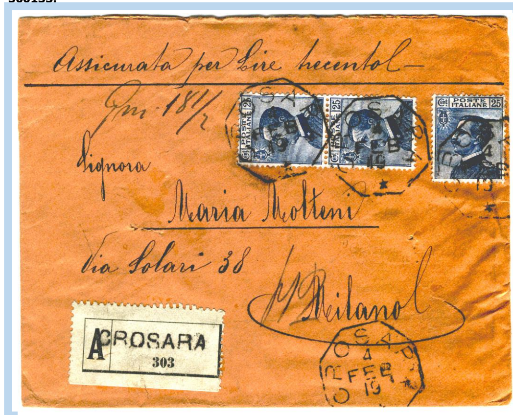
4.2.1919 – Lettera "Assicurata per Lire trecento" diretta a Milano tassata per 75 cent. (20c. porto lett. fino 15 gr. + 25c. raccomand.+ 30c. assicuraz.) con tre francobolli da 25c. annullati con bollo ottagonale " CROSARA 4 FEB 19 ". A lato etichetta con la "A" nera N° 303 -