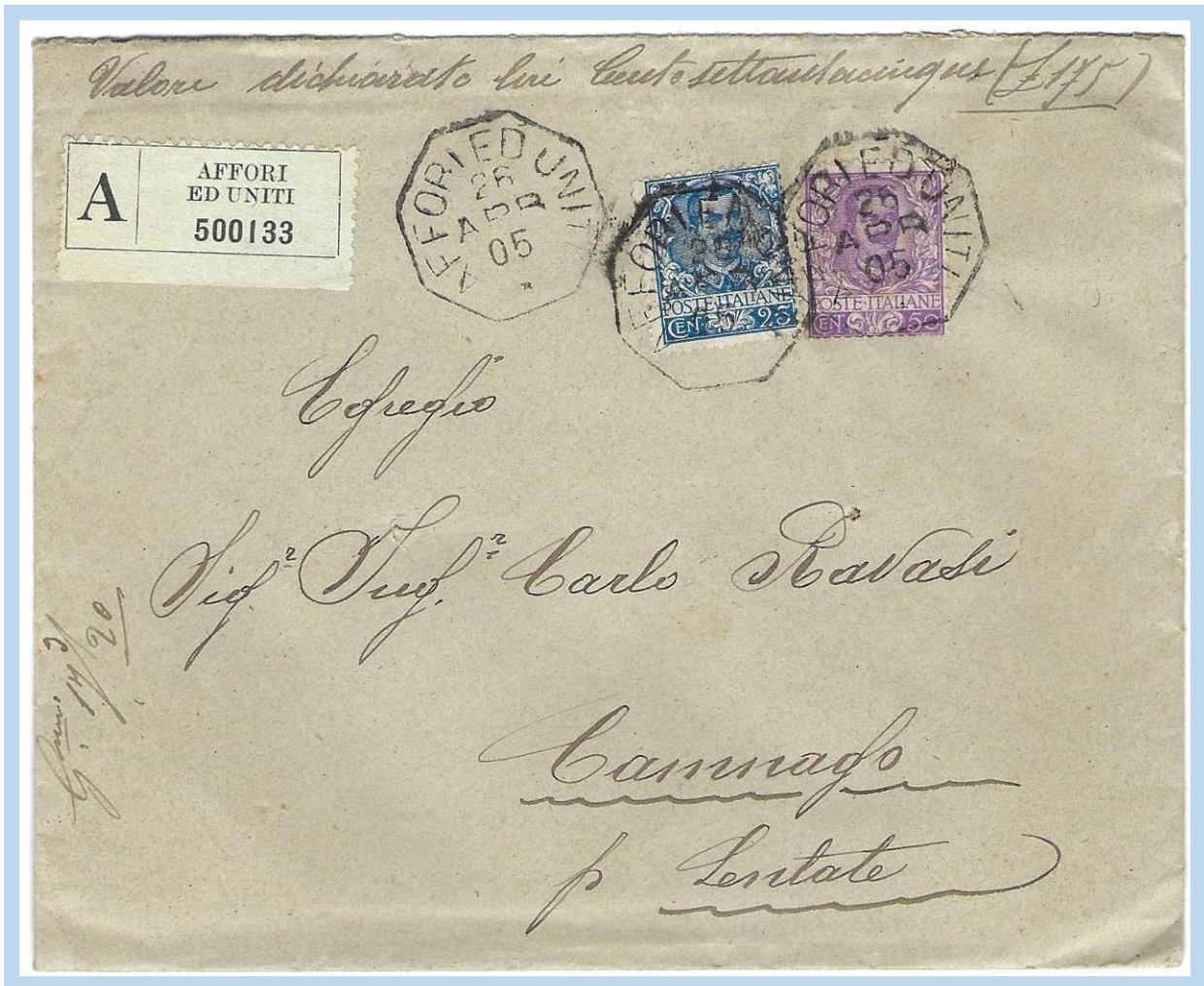
26.4.1905 - Lett. Assicurata per L.175,00 diretta a Carnago (CO), tassata di 75c. (40c. porto lett. fino 30 gr. + 25c. raccomand. + 10c. assicur.) e affran.ta con due fr.lii (25c.+ 50c.) annullati con bollo ottag." AFFORI ED UNITI 26 APR. 05 ". A lato etichetta con la "A" nera N° 500133 .

Quest'ultimi sono quelli che troviamo sulle Raccomandate e Assicurate con la "R" e la "A" maiuscola in nero.