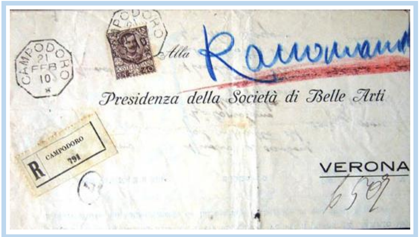
21.02.1910 - Lett. raccomandata diretta a Verona affrancata con un fran.llo da 40c. (15c. porto lett. fino 15 gr.+ 25c. raccomand.) annullato con bollo ottagonale " CAMPODORO 21 FEB. 10 ". A lato etichetta con "R" nero e N° 791".

Col 1° genn. 1904 viene ripristinato l'uso della etichetta con la "R" in nero in sostituzione del bollo "R. N. .."