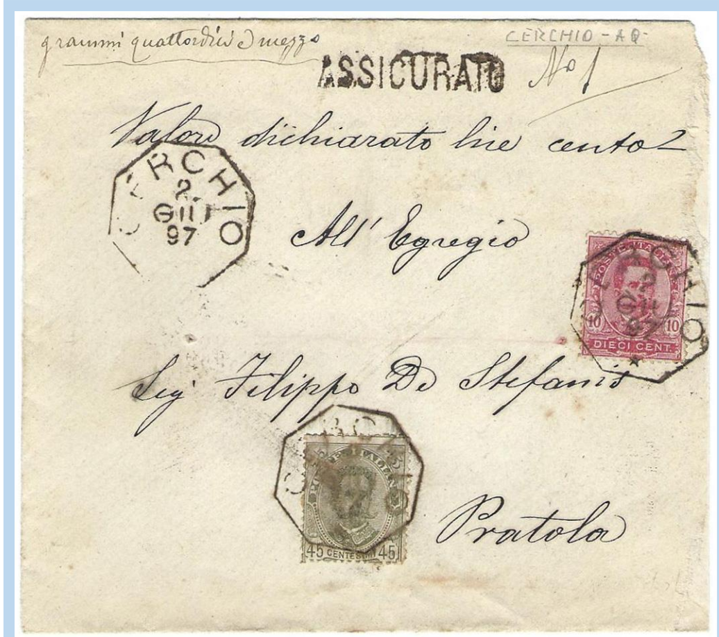
2.6.1897 - Lettera assicurata per " Valore dichiarato di Lire cento " diretta a Pratola (AQ) tassata 55c. (20c. porto lettera fino 10 gr. + 25c. raccomand. + 10c. assicuraz.) con 2 franc.lli (45c.+10c.) annullati con bollo ottagonale " CERCHIO 2 GIU 97 ". Su fronte bollo " ASSICURATO N°1 ".!!! In giugno prima assicurata !!!

Finite le scorte, l'etichetta dal 1.7.1890 veniva rimpiazzata dal bollo "ASSICURATO N. ..."