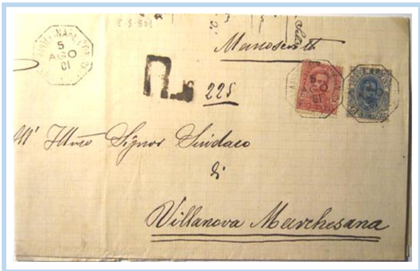
"SANT'APOLLINARE CON SELVA 5 AGO 1901" - Promossa al servizio delle raccomandate il 1.3.1886. Raccomandata Cent. 35 (10c. lett. aperta tra sindaci +25c. raccomand.)