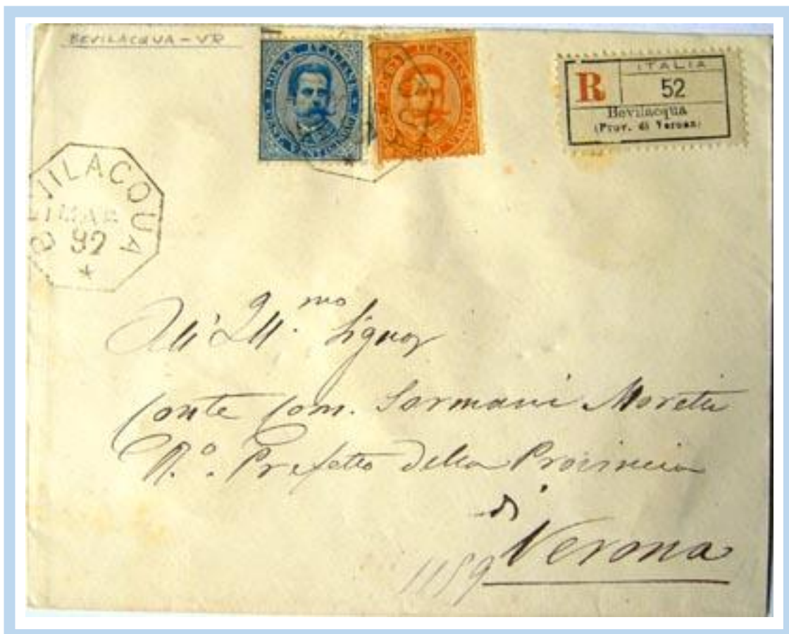
26.3.1892 - Lettera raccomandata diretta a Verona tassata 45c.(20c. lett. fino 15 gr. + 25c. raccomand.) affrancata con due francobolli annullati con bollo ottagonale " BEVILACQUA 26 MAR 1892 " - A lato etichetta con " R " rosso e N°52 . Promossa al servizio delle raccomandate il 1.12.1886.