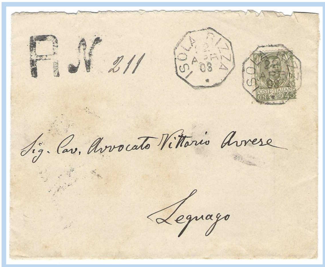
22.04.1903 - Raccomandata per Legnago affrancata con un 45c. (20c. lett. fino 15gr. + 25c. raccomand.) annullato con bollo ottagonale "ISOLA RIZZA 22 APR. 03". A lato bollo "R N° 211" .